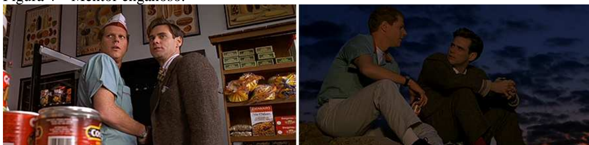
Figura 4 – Mentor enganoso.