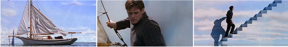
Figura 15 – Momentos finais.