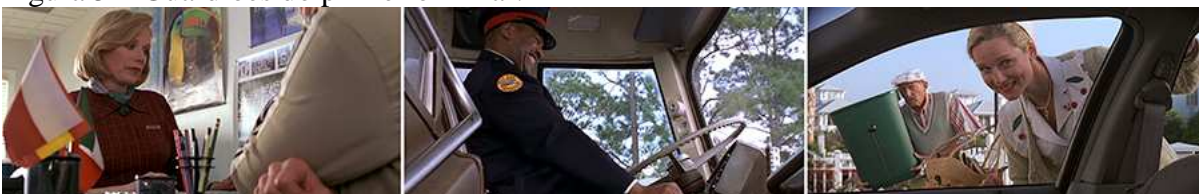
Figura 5 – Guardiões do primeiro limiar.

Fonte: O show de Truman - O Show da Vida (1998)