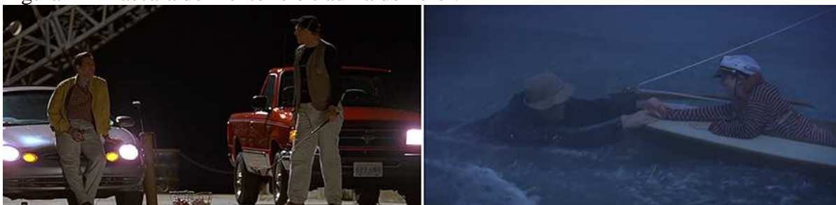
Figura 2 – Mascara do mentor e o trauma do herói.