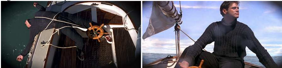
Figura 14 – Ressurreição.

Fonte: O show de Truman - O Show da Vida (1998)