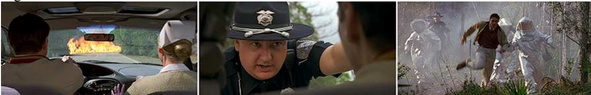
Figura 7 – Testes.