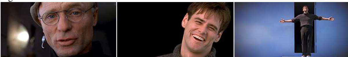
Figura 16 – Truman sai do show.

Fonte: O show de Truman - O Show da Vida (1998)