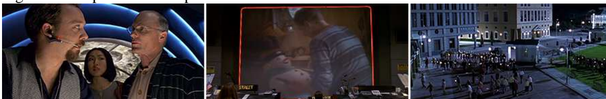
Figura 11 – Apanhando a espada.