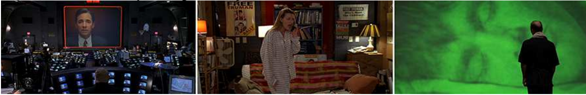
Figura 9: Christof e Sylvia, aproximação da caverna oculta.