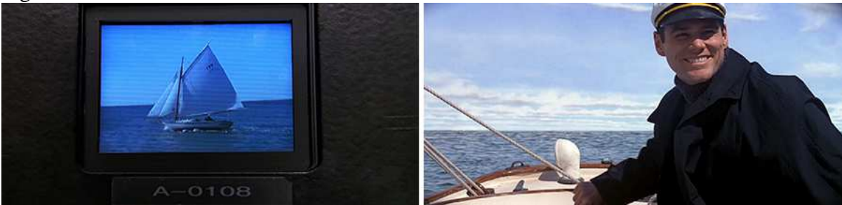
Figura 12 – Caminho de volta.