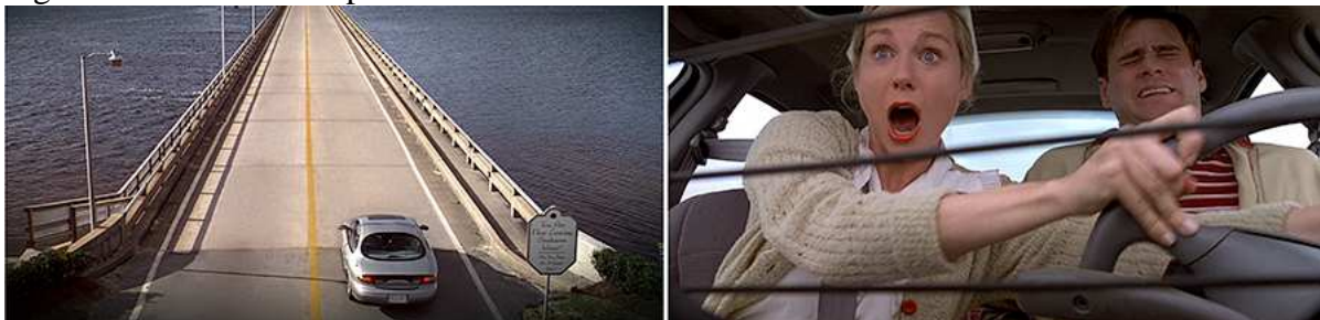
Figura 6 – Travessia do primeiro limiar.