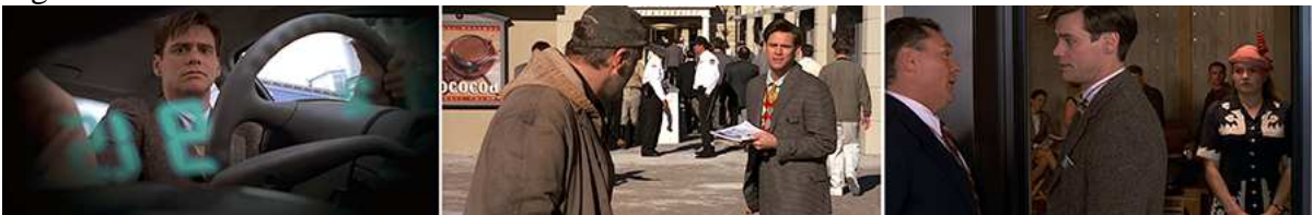
Figura 3 – Falhas técnicas.

Fonte: O show de Truman - O Show da Vida (1998)