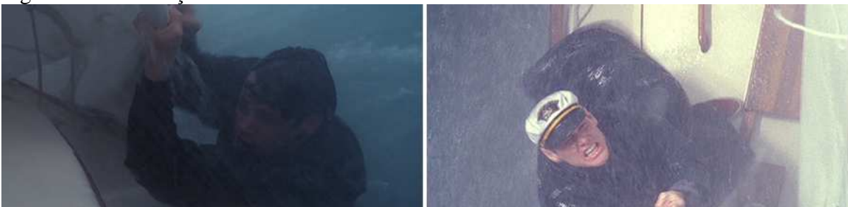
Figura 13 – Retaliação.